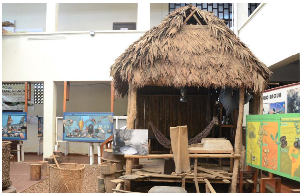
Figura 1. Demostración de choza de jatata dentro el museo

El museo de Historia Natural Pedro Villalobos de Universidad Amazónica de Pando, tiene como su principal objetivo producir investigación científica para fortalecer la educación ambiental, para de este modo poder prevenir graves problemas ambientales a causa de la falta de conciencia de las personas.